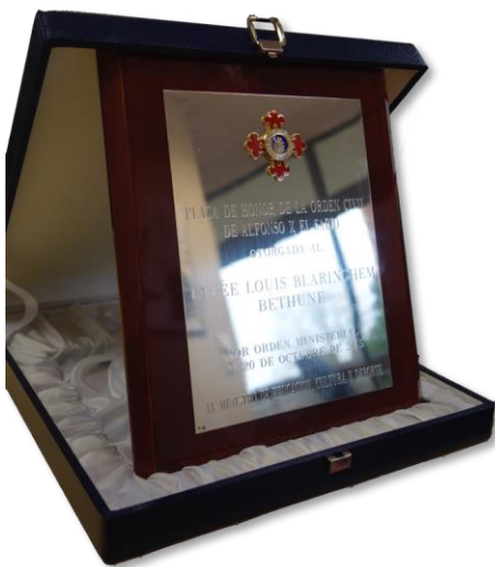
Plaque d'honneur décernée au lycée par le ministre espagnol de l'Éducation en 2015 pour l'excellence de ses résultats.

261 Bachilleratos obtenus (99,23% de réussite)